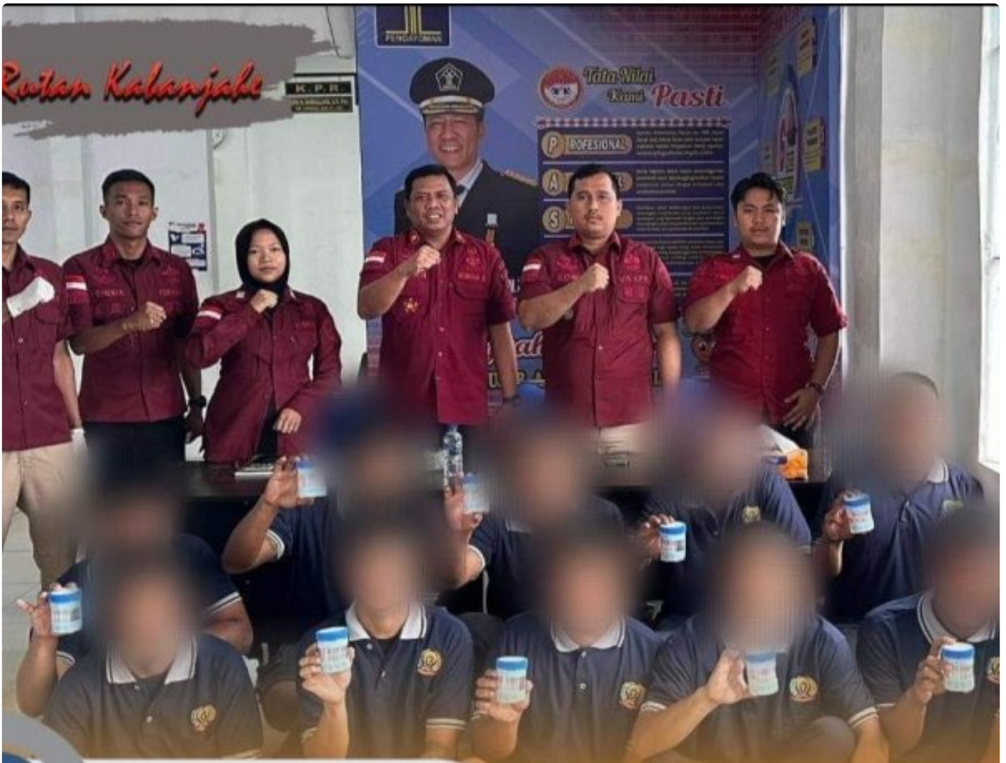
Rutan Kelas IIB Kabanjahe Test Urine Warga Binaan, Jumat (11/10-2024)

KARO - Untuk pencegahan dini akan adanya penyalahgunaan narkotika yang rentan terjadi, karena diselundupkan ditengah warga binaan.